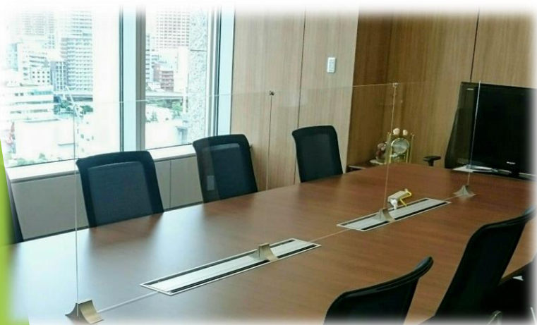
都内企業様 (役員応接室)

使い勝手の良さに加え、意匠性と安定性を評価していただき、お陰様で累計販売500個を達成し、これまでに全国20都府県へ納入いたしました。